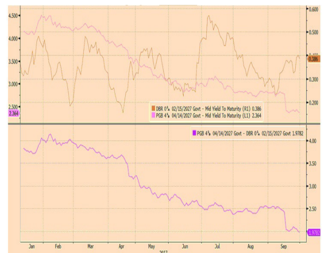
Spread OT27 vs Bund27 (197pts)

No final do mês registou-se a subida de rating da dívida portuguesa pela S&P, o que foi recebido com entusiasmo pelos investidores.