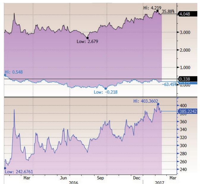
Spread OT26 vs Bund26

Em Portugal, o destaque foi para o BCP e o aumento de capital de €1.3MM para pagar os CoCos e reforçar rácios de capital.