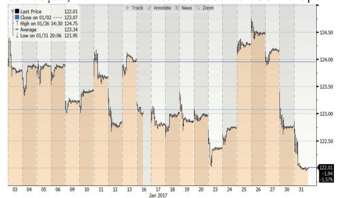
Evolução do MSCI Europe

No UK, o destaque vai para a obrigatoriedade imposta pelo Supremo Tribunal Britânico à aprovação do Brexit pelo parlamento. Num discurso sobre a saída, a PM adoptou um discurso soft , deixando no entanto clara a saída do Mercado Único mas, assumindo a possibilidade de novos acordos comerciais com os parceiros Europeus. Neste contexto, o Footsie 100 iniciou o ano a renovar máximos históricos mas acabando o mês em ligeira correcção, num movimento idêntico ao MSCI Europe.